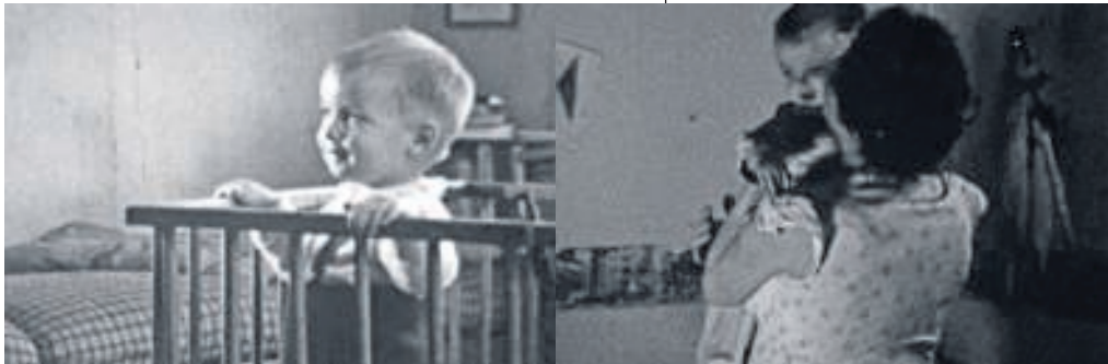
Boven: amateurfilmpjes van vroeger. BEELD: AMATEURFILMPLATFORM.NL Onder: homevideo's op YouTube.

Dat is positief, vindt Aasman. Het scheidt een rijker beeld van onze tijd. Maar omdat we niet een, maar wel vijftig filmpjes van de eerste stapjes van onze baby hebben, en ook nog eens honderden van zijn of haar eerste, tweede en twintigste lachje, boertje en woordje, zijn we ons onvoldoende bewust van het belang om die video's goed te bewaren.